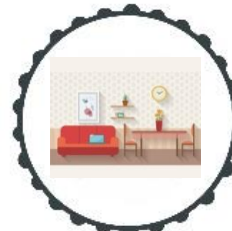
POKÓJ W DOMU