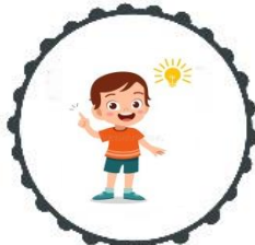
SPOSÓB NA NUDE